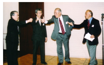
石川武塾事業室長