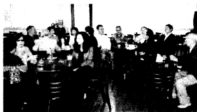
ウィスキーの試飲を楽しむ