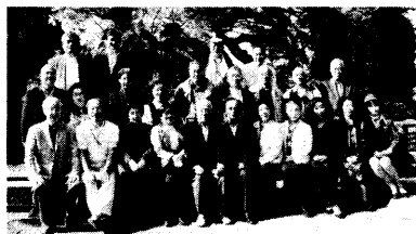
鐘山苑で記念撮影