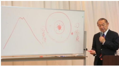
“講演される藤崎前駐米大使”