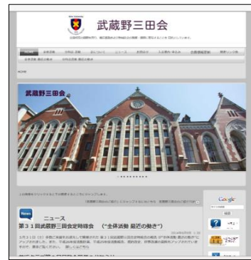
“ホーム・ページのトップページ”