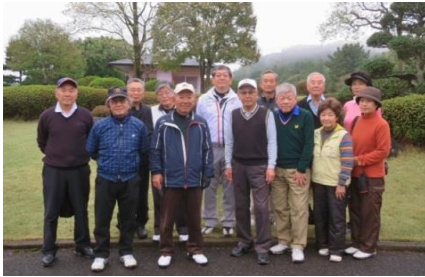
“春の大会参加の皆さん”