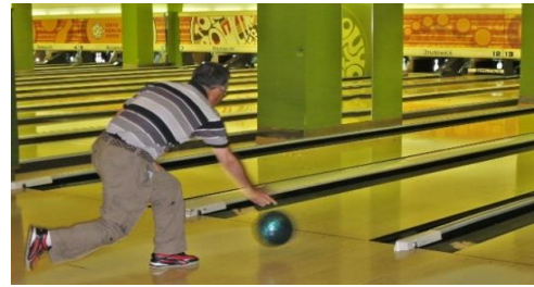
“華麗(?)なる投球フォーム”