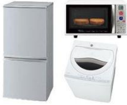
“独り暮らし家電3点”