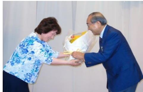
“退任された内田前会長へ花束贈呈”