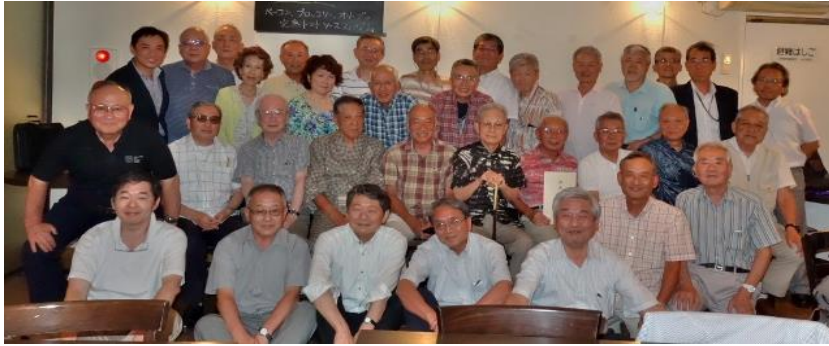
“納涼会参加者全員で”