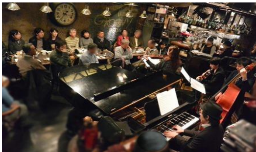
“平成26年12月14日「サムタイム」にて”