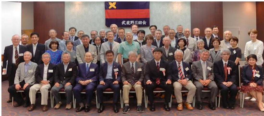
【2023年5月27日(土) 武蔵野三田会 第40回総会 吉祥寺 東急REIホテル】