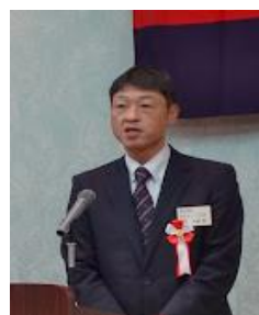
【中里塾員センター課長】