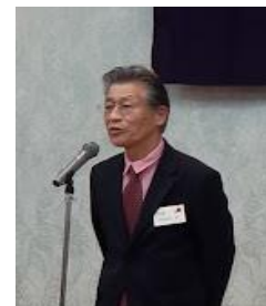
【下島副会長：閉会の辞】