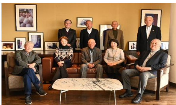
【1月28日参加者全員で】