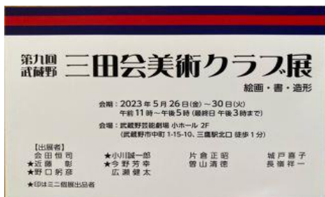
【第九回武蔵野三田会美術クラブ展案内状】