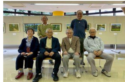
【展示会場において全員で】