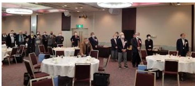
【「若き血」・「丘の上」斉唱】