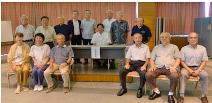
【講演会終了後に全員にて記念撮影】