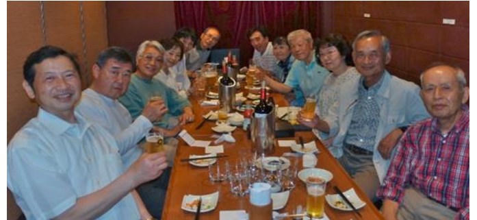
【プレー後の表彰・歓談】