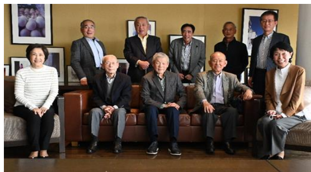
【2月12日参加者全員で】