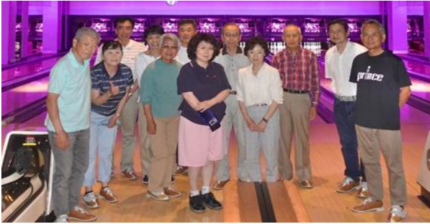
【第50回記念大会プレー前】