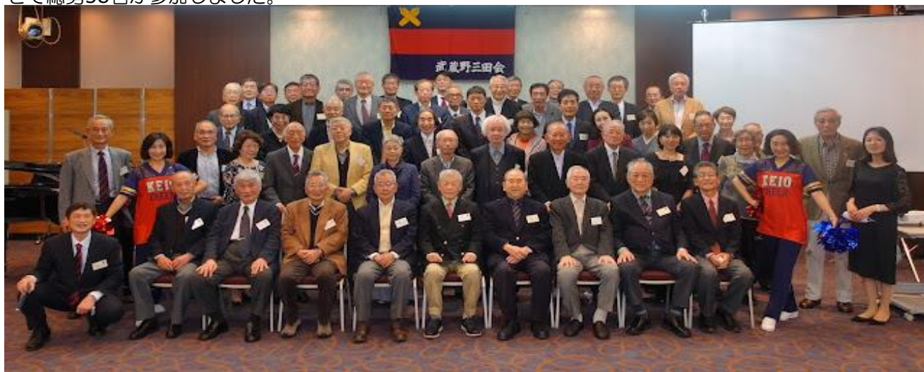
【参加者全員での記念撮影】