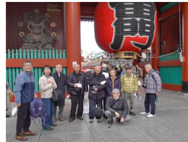
【浅草寺雷門の前で】