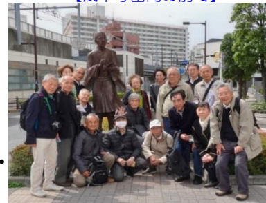
【松尾芭蕉像の前で】