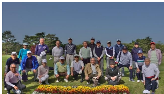
【第41回コンペ参加者全員で】