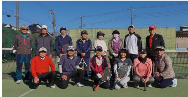
【紅白戦参加メンバー全員で】