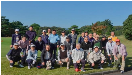
【第40回コンペ参加者全員で】