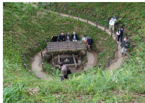
【まいまいず井戸を探索】