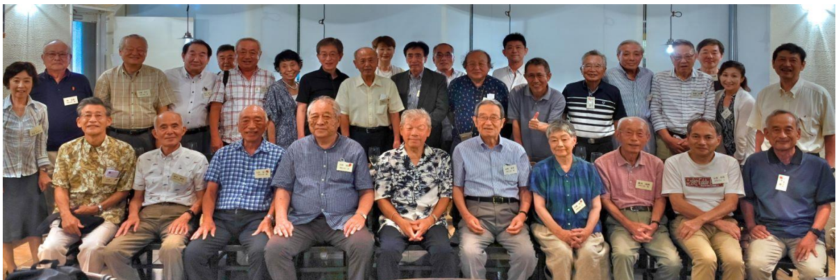
【2023年7月18日(火) 納涼懇親会 AZ DINING三鷹店】