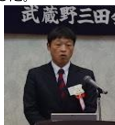
【中里塾員センター課長】