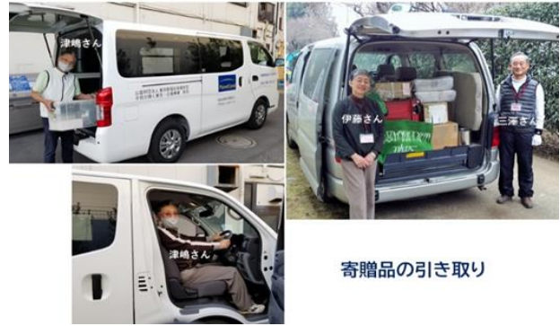
寄贈品の引き取り