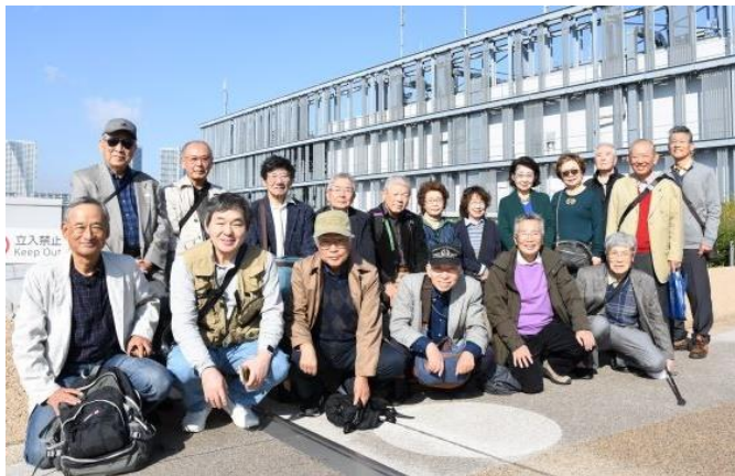
【豊洲市場屋上で参加者全員で】