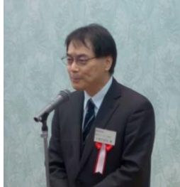
【小島塾員センター部長】