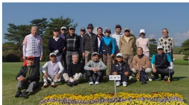
【第38回コンペ参加者全員で】