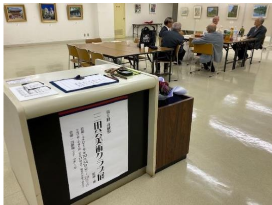
【展示会場での打ち合わせ風景】