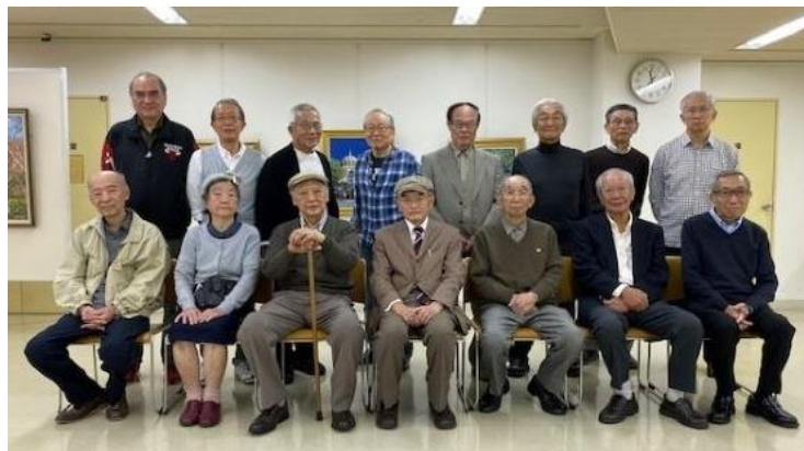
【展示会場で展示者全員で】