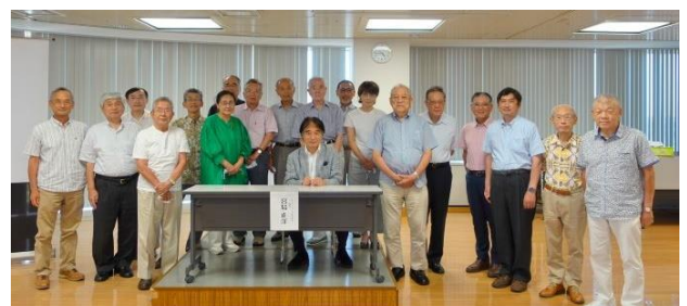
【講演会終了後参加者とともに】