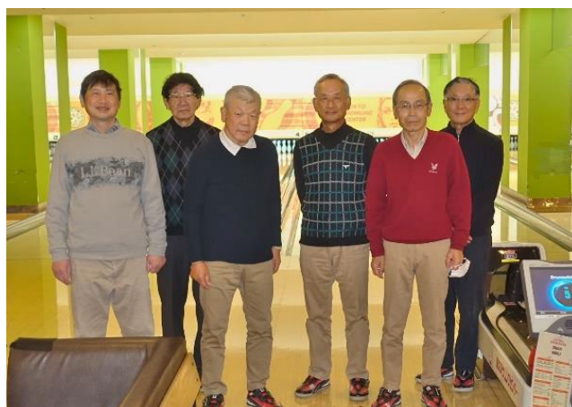
【毎回参加者全員で】