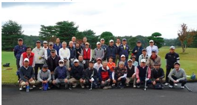
【三鷹三田会との合同コンペ参加者全員で】