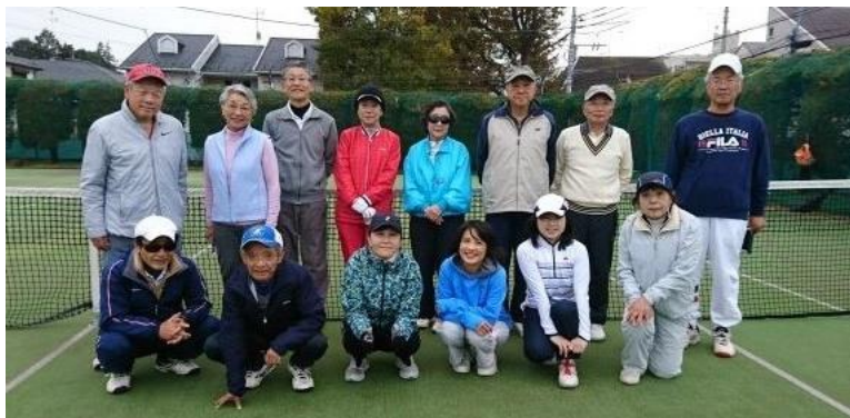
【紅白戦の前に参加者全員で】