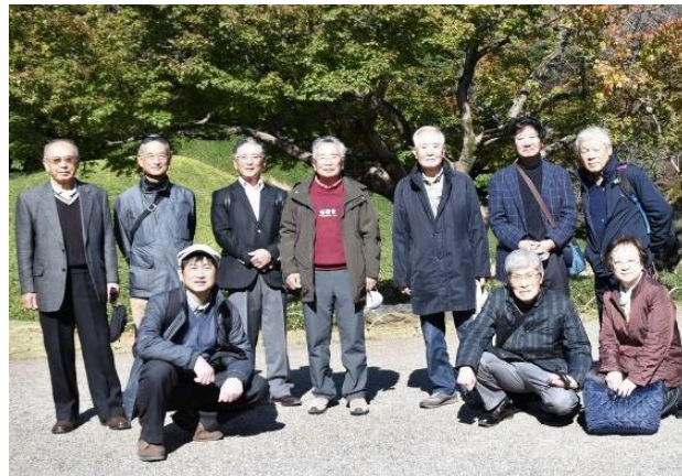
【小石川後樂園で参加者全員で】