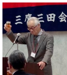
【泉三鷹三田会会長】