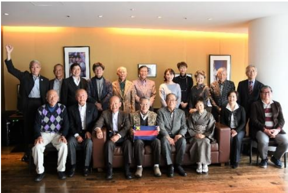
【2020年2月15日参加者全員で】