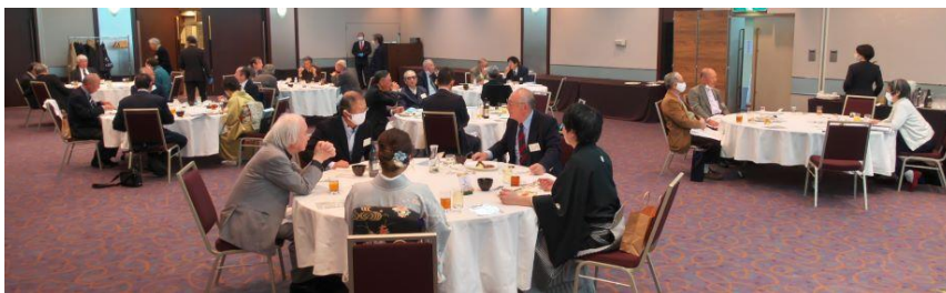
【密を避けた会場で、歓談が弾み、福引で盛り上がりました】