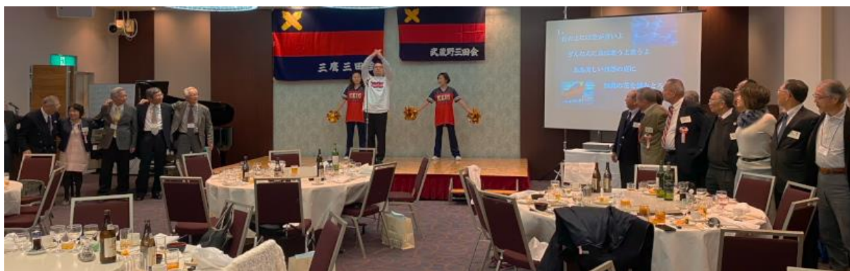
【武蔵野・三鷹三田会若手による指揮のもと全員で「丘の上」斉唱】