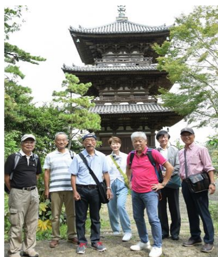
【旧燈明寺三重塔前で参加者全員で】