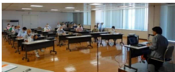
【密を避けた配置の講演会の様子】