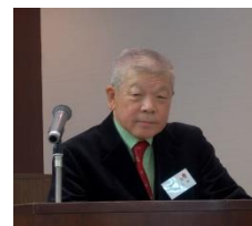
【司会：平尾事務局長】