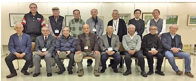
会場設営直後の会員記念撮影