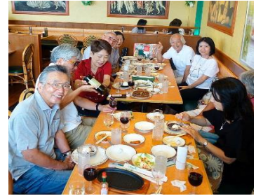
2018年上期納会の様子