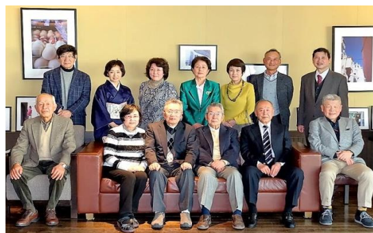
会食後の記念撮影