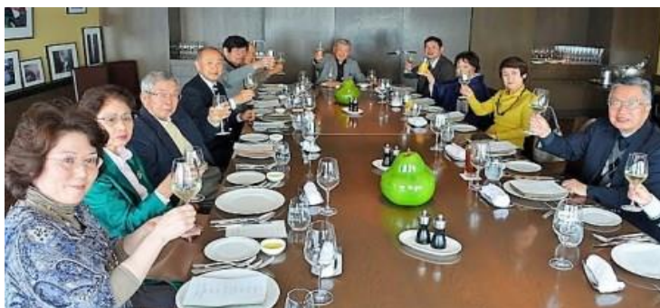
イタリアン会食のスタート「白ワインで乾杯」