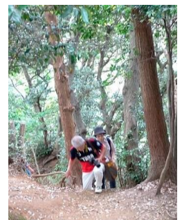
源氏山公園への険しい道のり