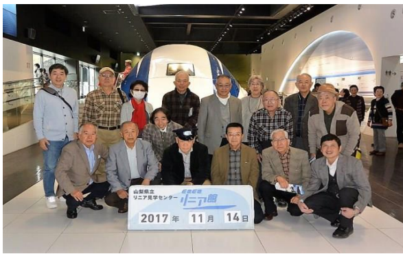
リニア見学センターにて(H29.11.14)