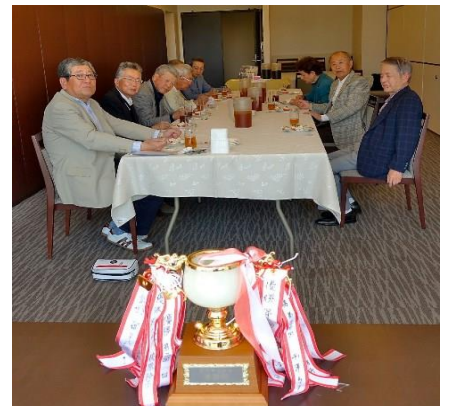
試合後の団欒風景