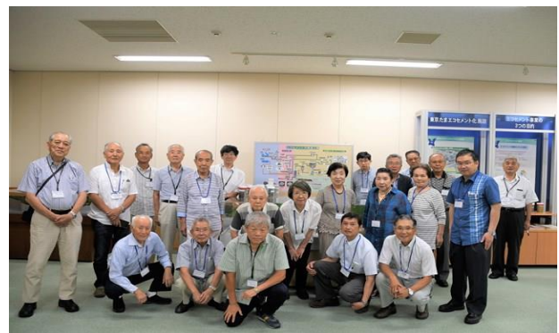
二ツ塚ごみ最終処分場にて(H30.7.12)