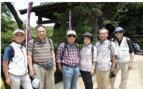
円覚寺「洪鐘」の前にて