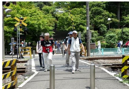
円覚寺から東慶寺へ