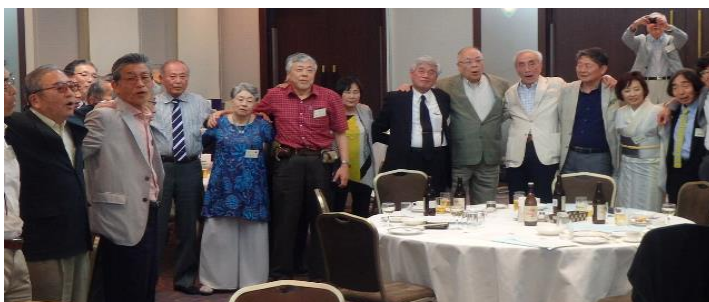
肩を組んで「若き血」