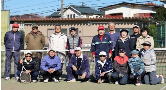
ある日の参加者全員で