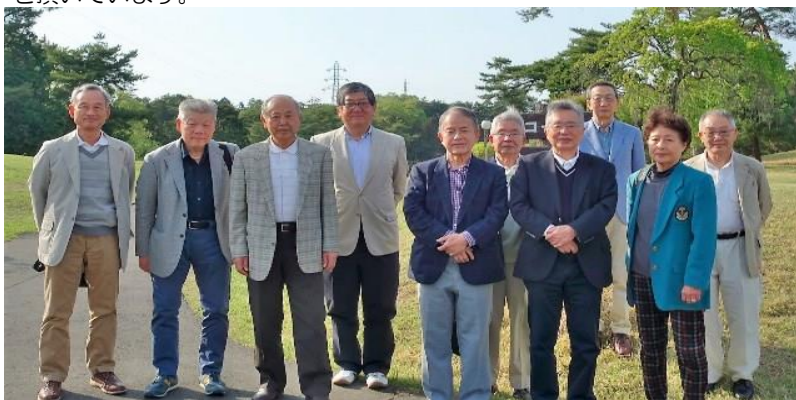
平成30年4月13日（金）第34回コンペ参加者全員で