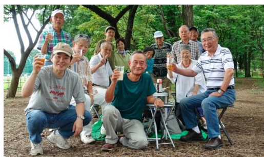
平成29年8月20日「武蔵野中央公園にて」