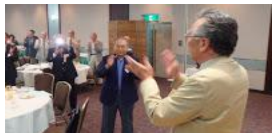
手締めでお開きに