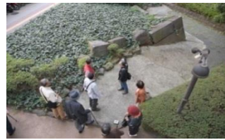
← 江戸城外堀跡溜池橋台