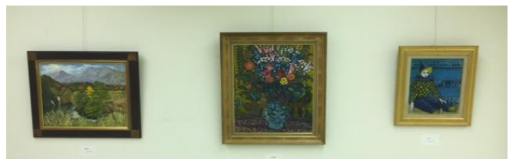
展示作品の一部：絵画（上）と書（左）