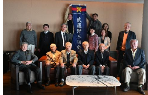
【3月16日参加者全員で】