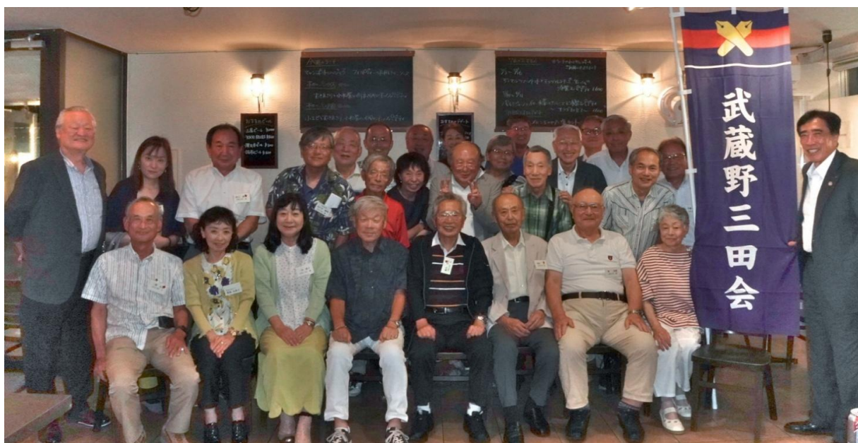
【2025年7月15日 納涼懇親会 AZ DINING三鷹店】