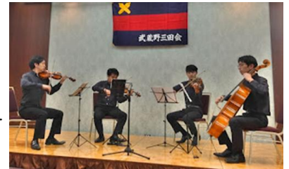
【ムジークフェライン室内楽団】