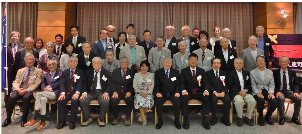
【2025年5月24日(土) 武蔵野三田会 第42回総会 武蔵野スイングホール11階レインボーサロン】