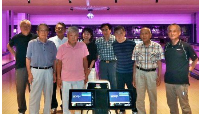
【7月22日の大会でプレーの前に全員で】