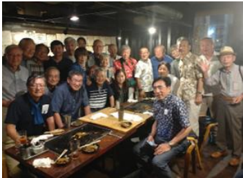
【六甲山で参加者全員】