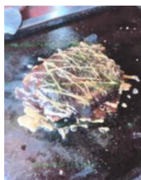
【人気の四角いお好み焼き】