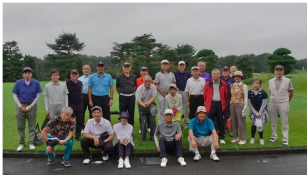
【第43回コンペ参加者全員で】