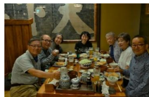
【水道橋の「かつ吉」で】