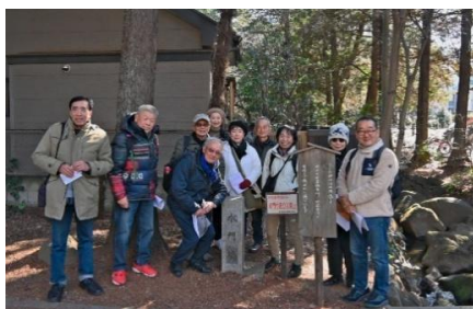
【スタートの井の頭公園で】