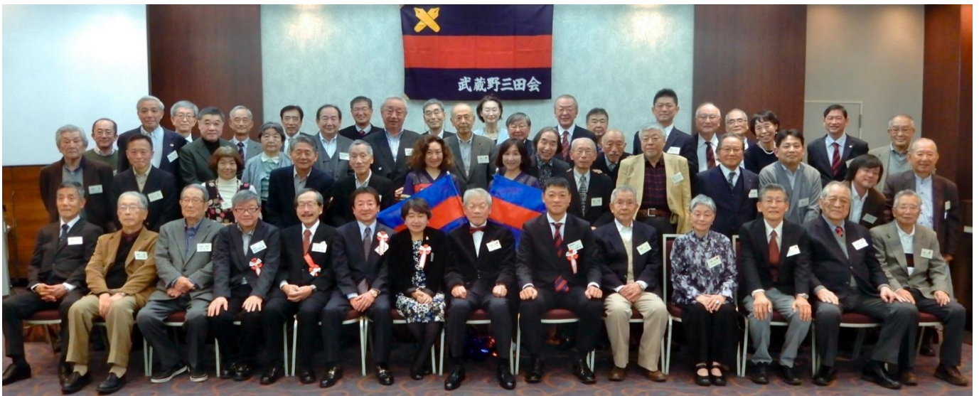
【2024年11月30日 武蔵野三田会忘年懇親会 吉祥寺 東急REIホテル】