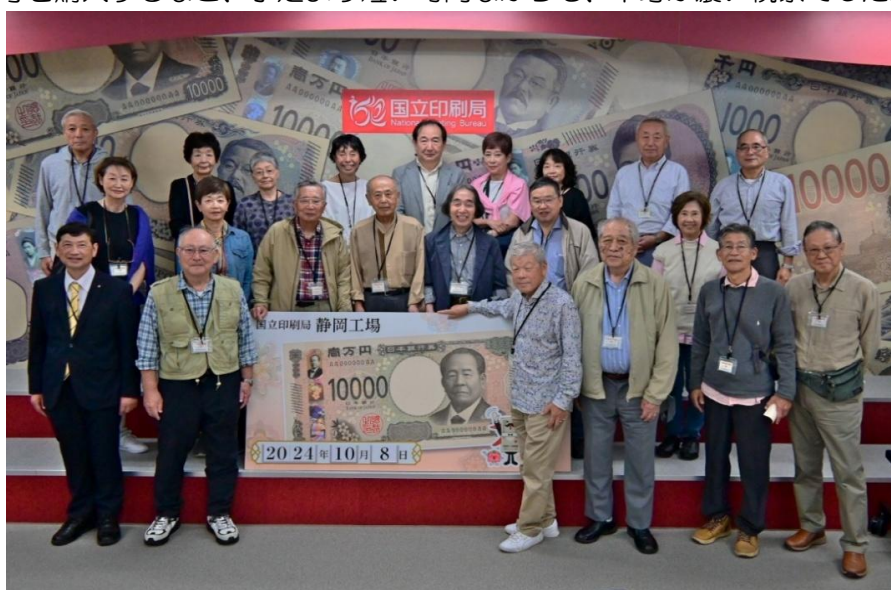
【2024年10月8日(火)2024年度武蔵野福澤諭吉研究会 国立印刷局静岡工場】