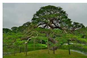
【小石川後樂園の松】