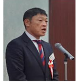
【中里塾員センター課長】