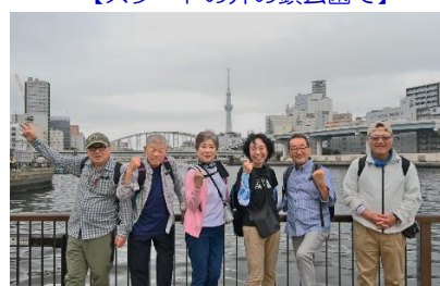
【隅田川の合流点で完歩を喜ぶ参加者】