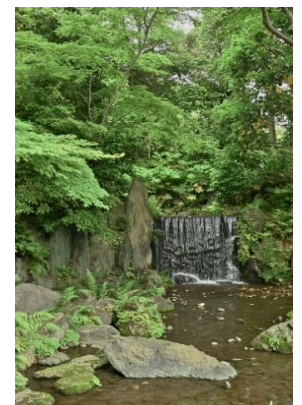
【小石川後樂園のお庭】