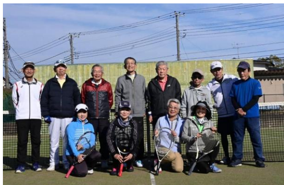
【紅白戦参加メンバー全員で】