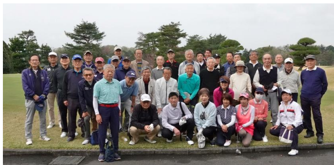
【武蔵野三田会・三鷹三田会 第4回合同コンペ参加者全員で】