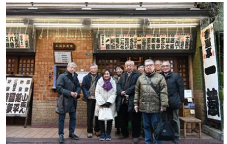
【12月23日に参加者全員で】